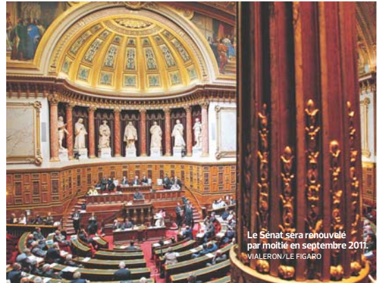
Le Sénat sera renouvelé par moitié en septembre 2011.

Les élus locaux qui sont au cœur de l'électorat sénatorial ont connu une relative « professionnalisation » (mandat à plein-temps, statut d'élu local, permanence de parti) et un renforcement croissant du poids de la fonction publique qui sont autant de processus qui favorisent plutôt la gauche que la droite. Enfin, dans nombre de départements ruraux, apparaissent des profils relativement atypiques par rapport à la « norme » de l'élu local agriculteur exploitant. Du fait de la désertification et du déclin de la population agricole, ce sont souvent de nouveaux résidents d'origine urbaine et plus orientés vers la gauche qui deviennent conseillers municipaux dans les petites communes. Une étude sur le profil des maires, menée par la Direction générale des collectivités locales après les