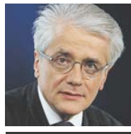
PAR PASCAL PERRINEAU DIRECTEUR DU CEVIPOF

Actuellement, le rapport de forces politique au Sénat est le suivant : sur les 343 sénateurs, 24 appartiennent au groupe communiste, républicain, citoyen et des sénateurs du Parti de gauche, 116 au groupe socialiste, 17 au groupe du Rassemblement démocratique et social européen (RDSE), 29 au groupe de l'Union centriste, 150 au groupe de l'UMP et 7 sont non inscrits. En septembre 2011, le nombre de sénateurs passera à 348 et la moitié des sièges sera renouvelée. La majorité absolue sera donc fixée à 175 sénateurs. Aujourd'hui, la gauche peut compter sur 24 membres du groupe communiste, 116 du groupe socialiste et 13 des 17 sénateurs du groupe RDSE, soit 153 sénateurs. Il lui faudrait