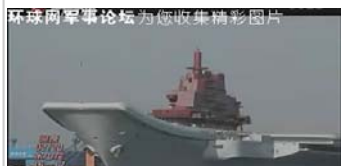
L'ex- Varyag ukrainien aujourd'hui Shi Lang , acheté en 1988 et modernisé depuis lors. 1 er essais officiels en mer le 1 er juillet 2011.