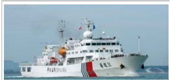
Le Haixun 31 , un des plus grands navires de surveillance chinois, en route vers Singapour...via la mer de Chine du sud, le 17 juin 2011.